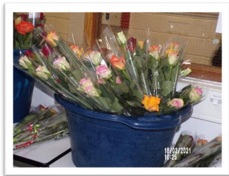
FIGURE 1 ROSES OFFERTES AUX ELEVES.

A VERNON, DES ELEVES D'UNE CLASSE DE TERMINAL DU LYCEE GEORGES DUMEZIL SE SONT TRANSFORMES EN CUPIDON POUR CETTE SAINT-VALENTIN 2021.