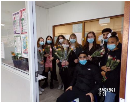
FIGURE 2: LA CLASSE DE TERMINAL ST2S A L'HONNEUR.

Elles m'ont répondu : « Nous étions toutes volontaires pour faire une bonne action et nous voulions démontrer que quand on veut faire quelque chose qui paraît difficile, on peut le faire. ».